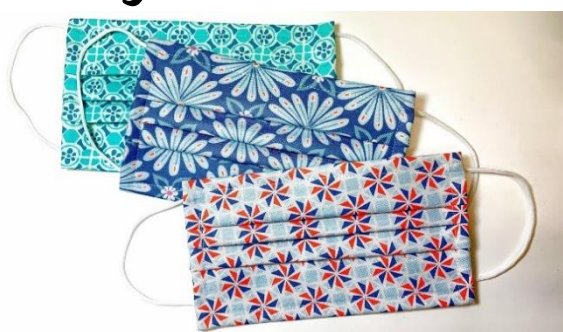
ماسک از پارچه