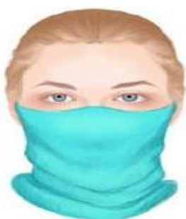
شال / دستمال گردن

از پارچه باشد. یک پارچه یا یک شال که جلوی دهان و دماغ را ببندد